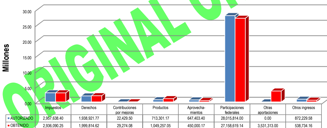
GRÁFICA 1 INGRESOS

Otras aportaciones: Programas regionales 2013 $848,360.00, Contingencias Económicas 2014 $2,682,953.00.